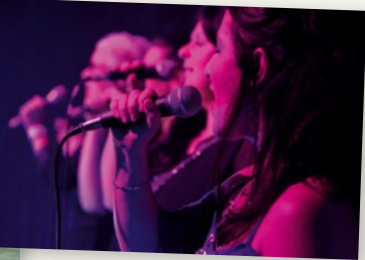
© Andy & The Singing Ladies